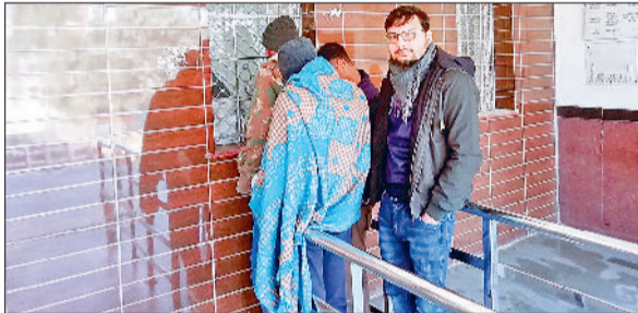
नारनौल। रेलवे स्टेशन पर एडवांस बुकिंग कराते हुए।