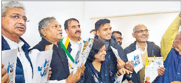
नारनौल। अभियान की शुरुआत पर गुप फोटो खिंचवाते कांग्रेस नेता।